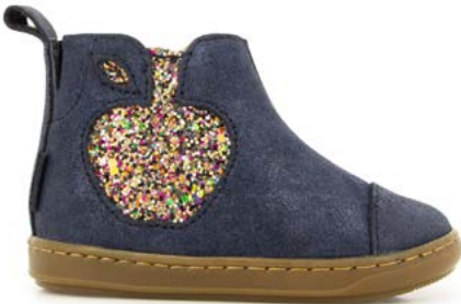
Bouba Apple 2 - Aegean - Gloss / Navy - Fiesta