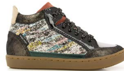
Play Connect 4 - Gloss Paint - Vernis / Black - Silver - Multi