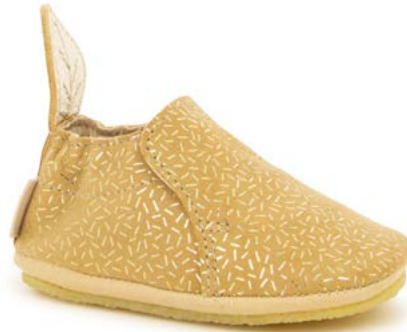
Shoo Easy 5 - Candy Sheep / Nuts - Platine