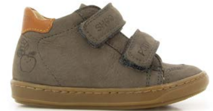
Bouba Scratchy 3 - Longbeach / Taupe - Camel