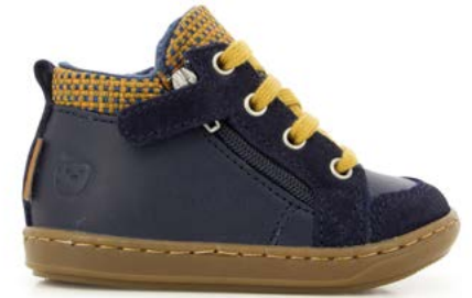
Bouba Zip Wool 4 - Regatta - Tie / Navy - Ocre