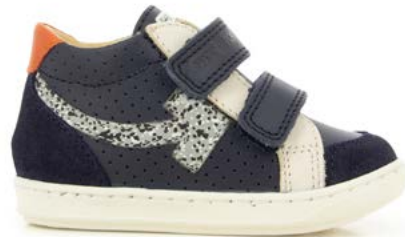
Bouba Scratch Arrow 1 - Regatta - Reflex Spoty / Navy - Craie - Rust