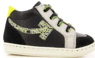
Bouba Arrow 3 - Kiri - Velours / Craie - Black - Kaki