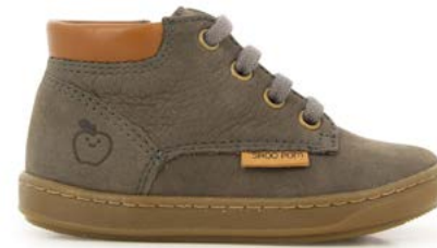
Bouba Zip Desert 3 - Longbeach / Taupe - Camel