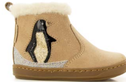
Bouba Ice 2 - Galaxy / Praline - Multi