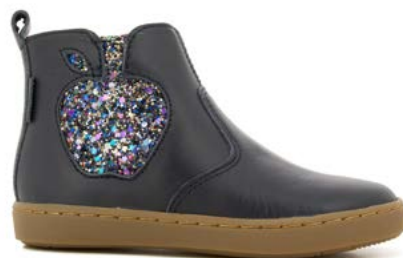
Play New Apple 2 - Nappa - Gloss / Navy - Multi