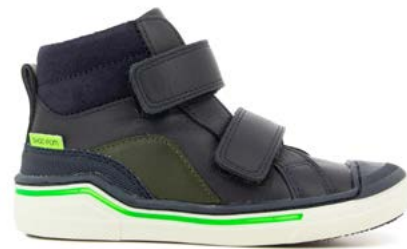
Pitch Bi Scratch 1 - Nappa - Velours / Navy - Pin - Green