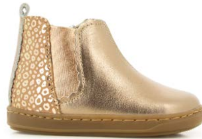
Bouba Jodzip 2 - Laminato - Baby Leo / Copper - Nude