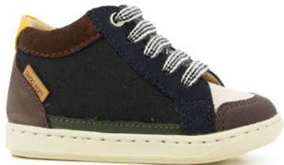
Bouba Connect 5 - Nubuck - Nylon / Black - Navy - Ocre