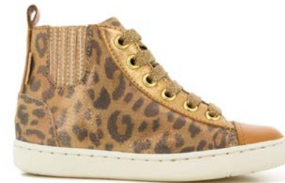
Play New Jodlace 3 - LeopardMetal-Laminato/Camel-OldGold