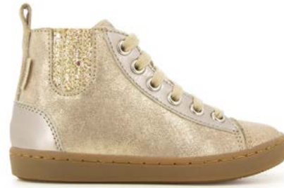
Play New Jodlace 2 - Aegean - Laminato / Taupe - Platine