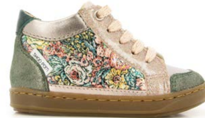
Bouba Connect 4 - Flowers - Dust / Pink - Eden - Multi