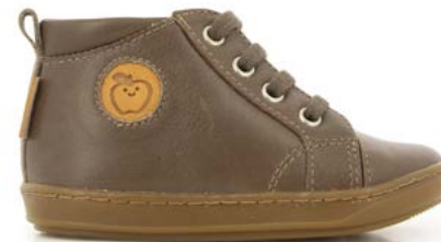
Bouba Zip Lace 3 - Formosa / Taupe