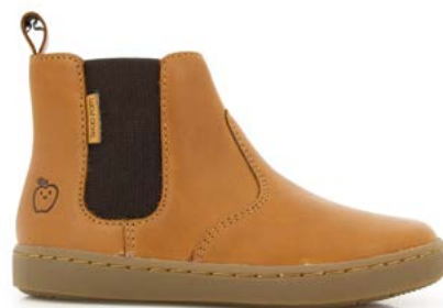
Play Chelsea 3 - Chip Munk / Camel