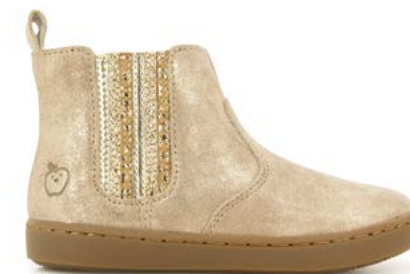
Play New Shine 4 - Aegean / Taupe - Platine