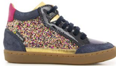
Play Connect 3 - Gloss - Aegean / Navy - Old Gold