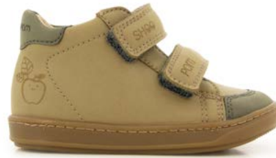
Bouba Scratch Veg 2 - Nobuck / Terra - Kaki