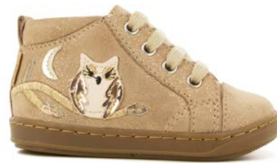
Bouba Bou-Bou 2 - Galaxy / Praline - Copper