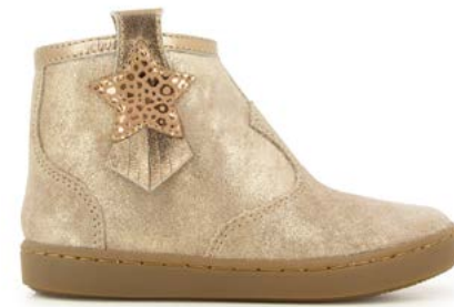
Play Kid 2 - Aegean / Baby Leo / Taupe - Platine