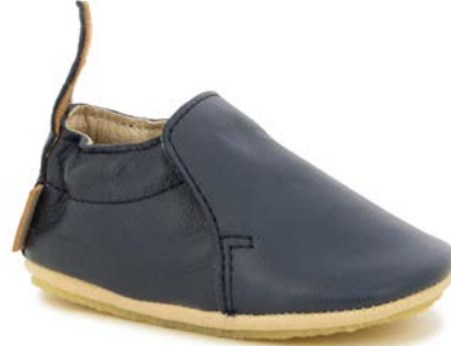
Shoo Easy 1 - Sheep / Navy