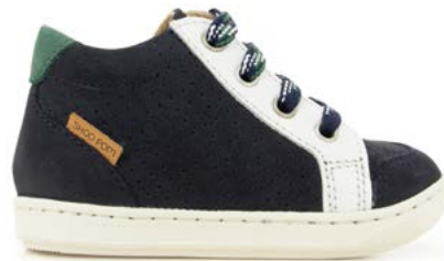
Bouba Zip Box 2 - Nubuck - Nappa / Navy - White - Green