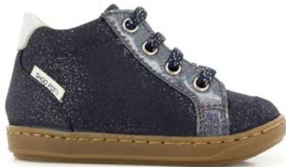
Bouba Zip Box 5 - Galaxy - Glitter / Navy - Blue