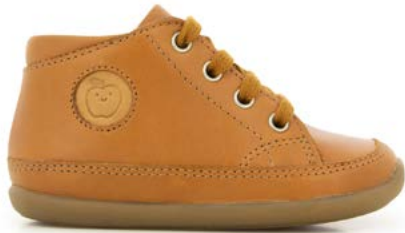
Cupy Zip Lace 1 - Kobe / Camel