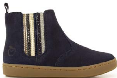
Play New Shine 1 - Velours / Navy - Multi