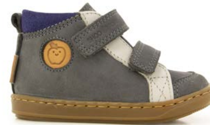
Bouba New Scratch 3 - Nubuck - Kiri / Piombo - Grey - Blue