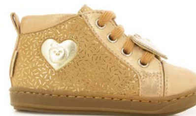
Bouba Heart 3 - Candy - Dust / Nuts - Platine