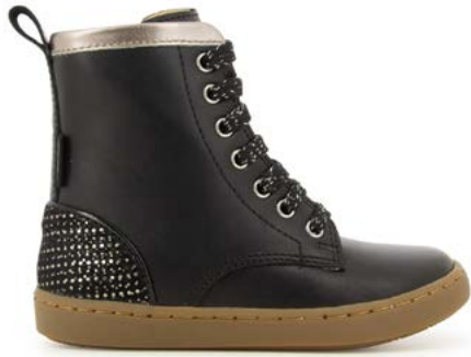
Play Hi Cut 1 - Chip Munk - Dotted / Black - Etain