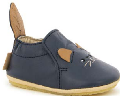
Shoo Miaou 1 - Sheep / Navy - Dark Camel