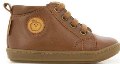
Bouba Zip Lace 2 - Formosa / Camel