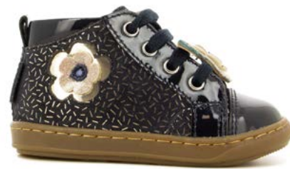
Bouba Floflo 1 - Candy - Vernis / Navy - Platine