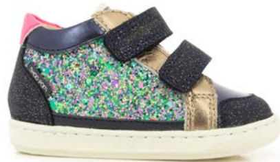
Bouba Easy Co 3 - Gloss - Galaxy / Navy - Copper - Fuxia