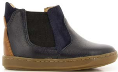
Bouba Chelsea 1 - Formosa - Velours / Navy - Camel