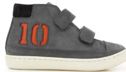
Play Alpha 2 - Nubuck / Piombo - Black - Rust