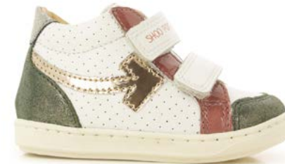
Bouba Scratch Arrow 7 - Nappa - Vernis / White - Eden - Old Rose