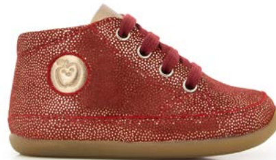
Cupy Zip Lace 4 - Polka Dots / Rubis - Copper