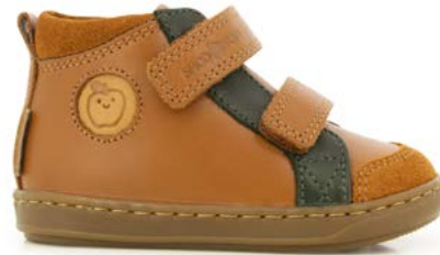
Bouba New Scratch 2 - Kobe - Velours / Camel - Pin