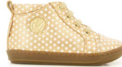
Bouba Zip Lace 7 - Dots / Gold - White