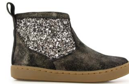
Play Co Boots 3 - Aegean - Gloss / Black - Metal