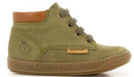
Bouba Zip Desert 4 - Longbeach / Army - Camel