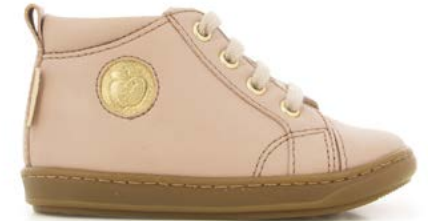
Bouba Zip Lace 4 - Nappa / Old Pink