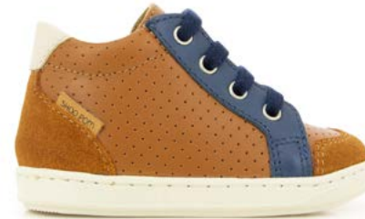
Bouba Zip Box 3 - Kobe - Velours / Camel - Dark Blue