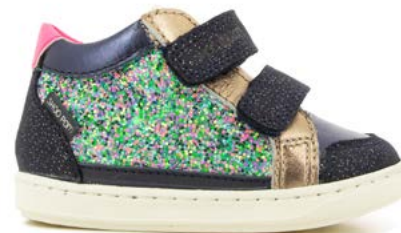
Bouba Easy Co 3 - Gloss - Glaxy / Navy - Copper - Fuxia