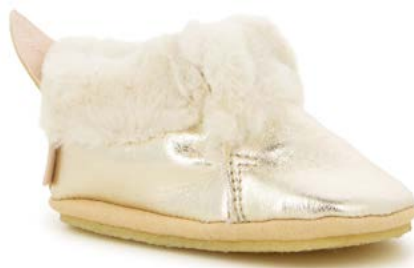
Shoo Fur 3 - Sheep Metal - Fourrure/Platine - Off White

Tige : Cuir sans chrome Upper : Chrome Free Leather