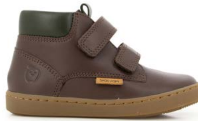
Play Desert Scratch 2 - Kobe / Choco - Pin