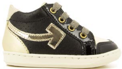
Bouba Arrow 5 - Nappa - Laminato / Black - Platine