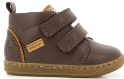
Bouba Panam 2 - Kobe / Choco - Camel