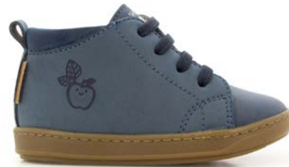
Bouba Veg 2 - Nobuck/ Jeans