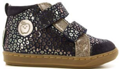
Bouba New Scratch 4 - Baby Leo - Glitter / Navy - Etain