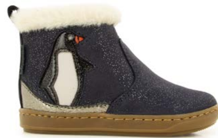
Bouba Ice 1 - Galaxy / Navy - Multi