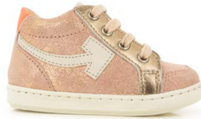
Bouba Arrow 6 - Aegean - Laminato / Old Rose - Copper - Peps