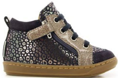
Bouba Bi Zip 4 - Baby Leo - Glitter / Navy - Etain