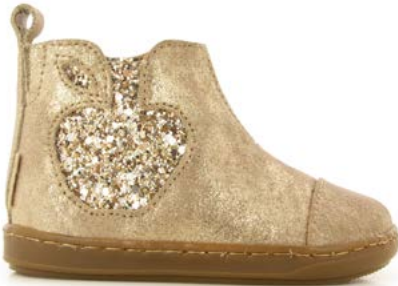
Bouba Apple 3 - Aegean - Gloss / Taupe - Platine