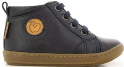
Bouba Zip Lace 1 - Formosa / Marine