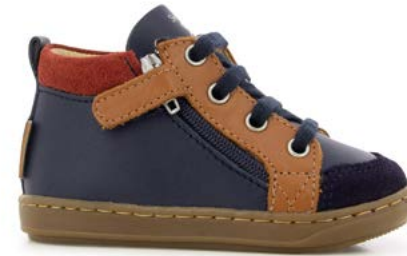
Bouba Bi Zip 1 - Regatta - Velours / Navy - Camel - Rust