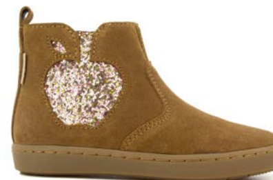
Play New Apple 3 - Velours - Gloss / Dark Camel - Golden