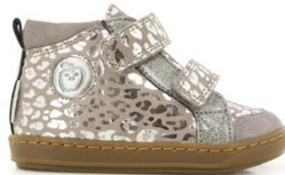
Bouba New Scratch 5 - Leo Metal - Glitter / Grey - Silver