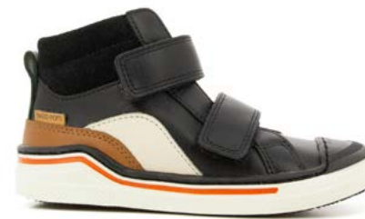
Pitch Bi Scratch 2 - Nappa - Velours/ Black - Camel - Craie