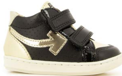
Bouba Scratch Arrow 5 - Nappa - Laminato / Black - Platine