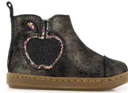
Bouba New Apple 3 - Aegean - Gloss / Black - Multi