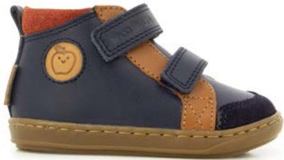
Bouba New Scratch 1 - Regatta - Velours / Navy - Camel - Rust