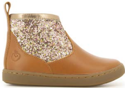
Play Co Boots 1 - Kobe - Gloss / Camel - Golden