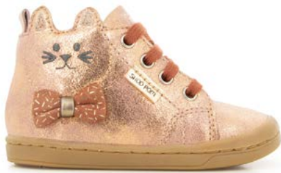
Kikki Wou 1 - Dust / Old Rose - Copper