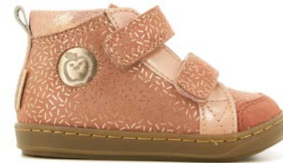
Bouba New Scratch 6 - Candy - Vernis / Old Rose - Copper