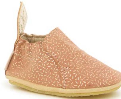
Shoo Easy 6 - Candy Sheep / Old Pink - Platine

Tige : Cuir sans chrome Upper : Chrome Free Leather