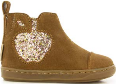
Bouba Apple 1 - Velours - Gloss / Dark Camel - Golden