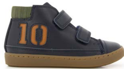
Play Alpha 1 - Nappa - Nubuck / Navy - Kaki - Camel