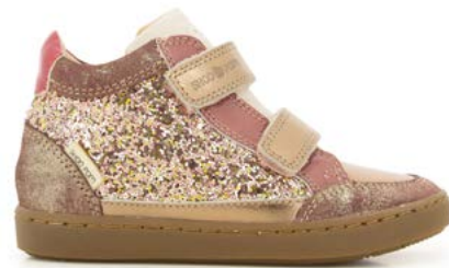
Play Easy Co 2 - Gloss - Vernis / Golden - Old Rose - Copper