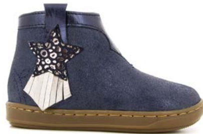
Bouba Kid 1 - Aegean - Baby Leo / Navy - Etain