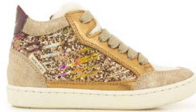
Play Connect Fur 2 - Gloss Paint - Laminato / Metal - Bronze - Purple