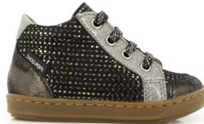
Bouba Zip Box 6 - Dotted - Glitter / Black - Acier