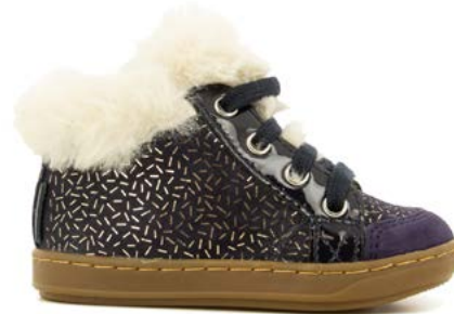
Bouba Zip Hair 2 - Candy - Fur / Navy - Platine