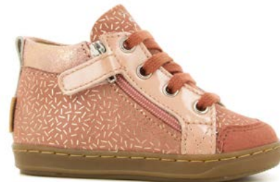
Bouba Bi Zip 6 - Candy - Vernis - Old Rose - Copper