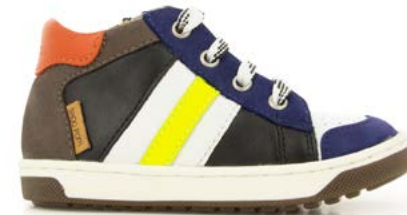
Oops Ducky 3 - Nappa - Nubuck / Black - Blue - Fluo