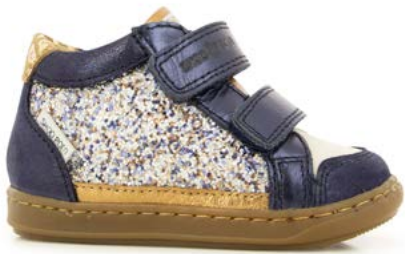
Bouba Easy Co 2 - Gloss - Dust / Navy - Old Gold