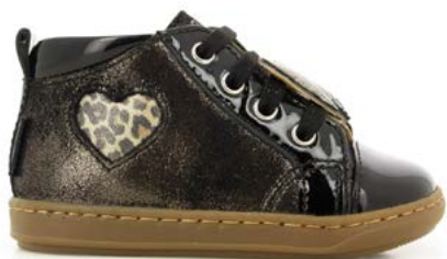
Bouba Heart 1 - Dust - Vernis / Black - Naturel