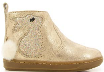
Bouba Pimpin 2 - Aegean - Glitter / Taupe - Platine