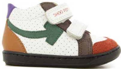
Bouba Scratch Arrow 4 - Nappa - Nubuck / White - Multi