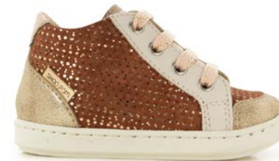
Bouba Zip Box 7 - Dotted - Dust / Antic - Craie - Copper