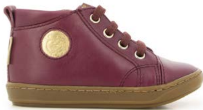
Bouba Zip Lace 5 - Cyclone / Berry