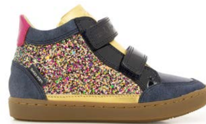
Play Easy Co 3 - Gloss - Aegean / Navy - Old Gold