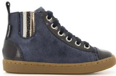
Play New Jodlace 1 - Aegean - Vernis / Navy - Multi