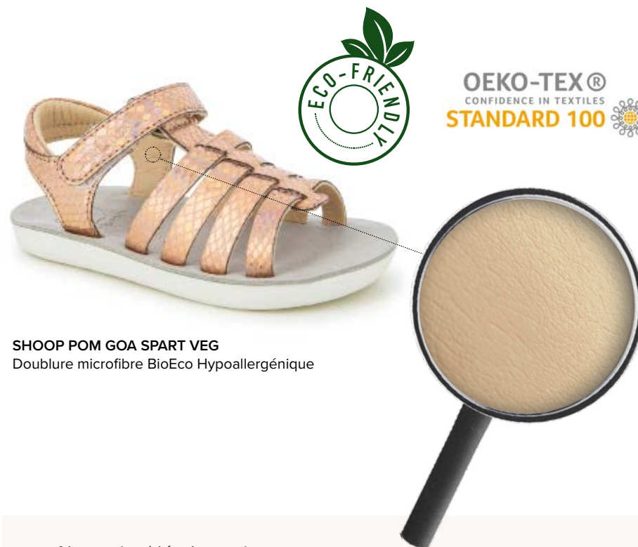
SHOOP POM GOA SPART VEG Doublure microfibre BioEco Hypoallergénique

Grâce à son effet thermorégulateur, elle offre un maximum de confort et un séchage total. La transpiration ne s'accumule pas à l'intérieur de la chaussure, car le tissu favorise son évaporation pour que le pied reste toujours sec.