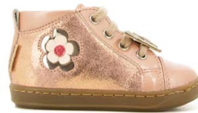
Bouba Floflo 2 - Dust - Vernis / Old Rose