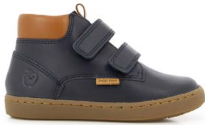
Play Desert Scratch 1 - Nappa / Navy - Camel