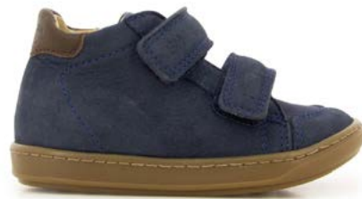
Bouba Scratchy 1 - Longbeach / Navy - Choco