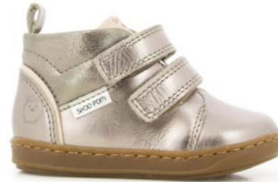
Bouba Panam 3 - Laminato - Dust / Pyrite - Pink