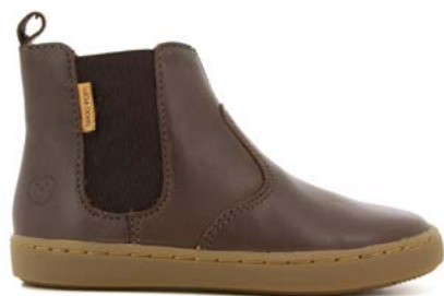
Play Chelsea 2 - Chip Munk / Choco