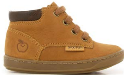
Bouba Zip Desert 2 - Longbeach / Camel - Choco