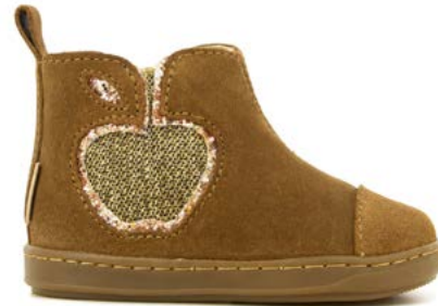
Bouba New Apple 2 - Velours - Gloss / Dark - Camel - Gold