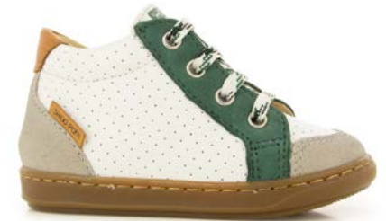
Bouba Zip Box 4 - Nappa - Velours / White - Green - Camel