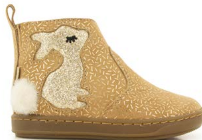
Bouba Pimpin 3 - Candy - Glitter / Nuts - Platine