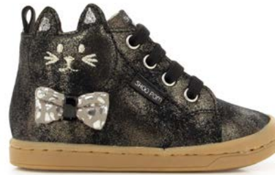
Kikki Wou 2 - Dust / Black - Silver