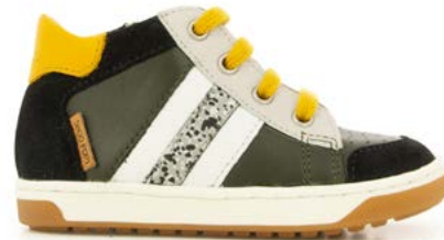
Oops Ducky 2 - Kobe - Velours / Pin - Black - Ocre