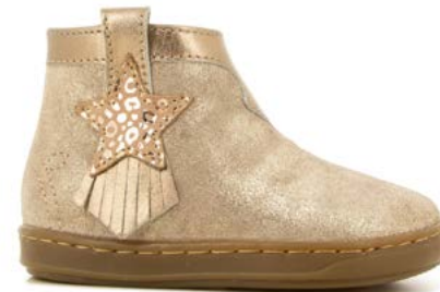
Bouba Kid 2 - Aegean - Baby Leo / Taupe - Platine