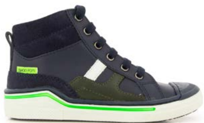
Pitch Hi Lace 1 - Nappa - Velours / Navy - Pin - Green