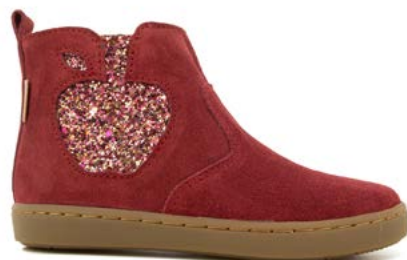
Play New Apple 4 - Velours - Gloss / Holly Berry - Multi