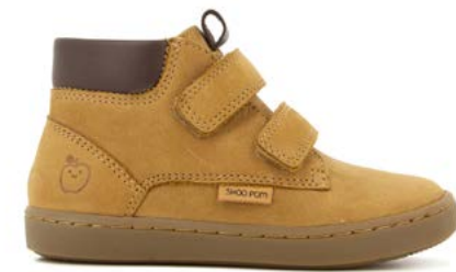
Play Desert Scratch 3 - Nubuck / Camel - Choco