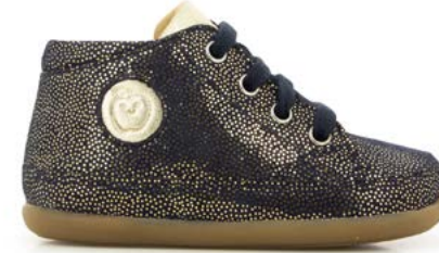
Cupy Zip Lace 3 - Polka Dots / Navy - Gold