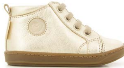
Bouba Zip Lace 6 - Metal Milled / Dark Silver