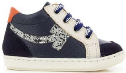
Bouba Arrow 1 - Regatta - Reflex Spoty / Navy - Craie - Rust