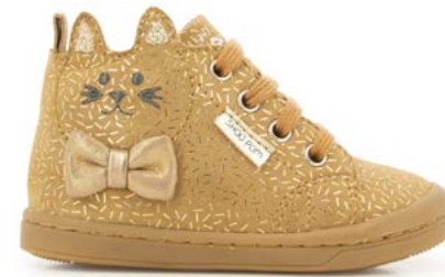
Kikki Wou 3 - Candy / Nuts - Platine