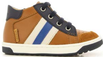
Oops Ducky 1 - Kobe / Camel - Navy - Blue