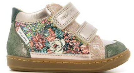
Bouba Easy Co 4 - Flowers - Dust/ Pink - Eden - Multi