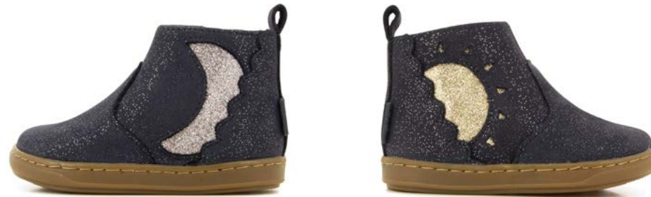
Bouba Am-Pm 1 - Galaxy - Glitter / Navy - Multi