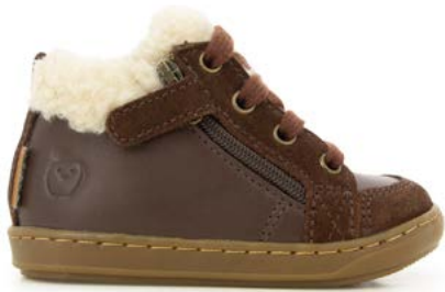
Bouba Zip Wool 1 - Kobe - Fur / Choco - Off White