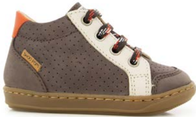
Bouba Zip Box 1 - Nubuck - Nappa / Navy - White - Green