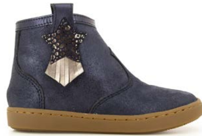
Play Kid 1 - Aegean - Baby Leo / Navy - Etain