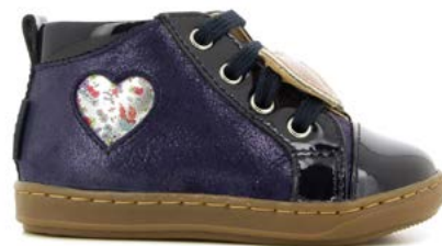
Bouba Heart 2 - Dust - Vernis / Navy - Nude