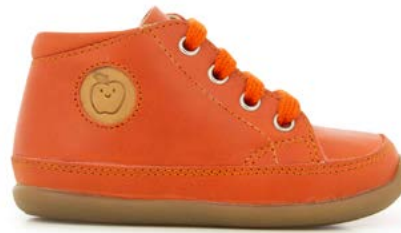
Cupy Zip Lace 2 - Monza / Rust