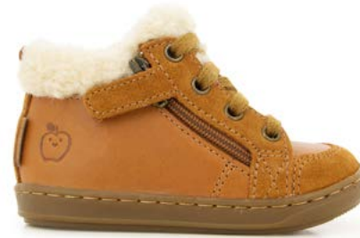
Bouba Zip Wool 3 - Kobe - Fur / Camel - Off White