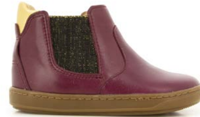
Bouba Chelsea 3 - Cyclone - Century / Berry - Or