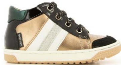
Oops Ducky 4 - Laminato - Vernis / Black - Copper