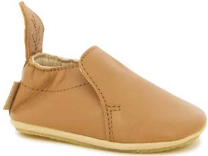
Shoo Easy 2 - Sheep / Dark Camel