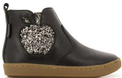
Play New Apple 1 - Nappa - Gloss / Black - Metal