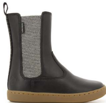
Play Hi Boots 1 - Chip Munk - Dotted / Black - Silver