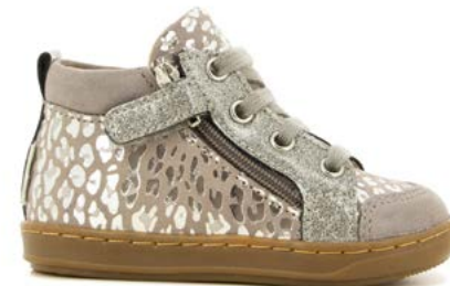
Bouba Bi Zip 5 - Leo Metal - Glitter / Grey - Silver