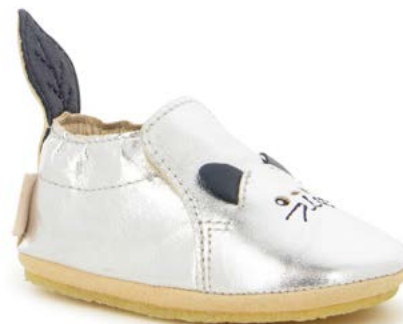
Shoo Miaou 2 - Sheep Metal / Silver - Navy

Tige : Cuir sans chrome Upper : Chrome Free Leather