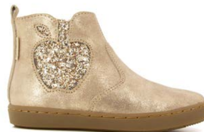
Play New Apple 5 - Aegean - Gloss / Taupe - Platine