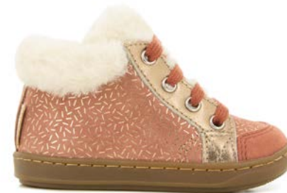
Bouba Zip Hair 3 - Candy - Fur / Navy - Platine