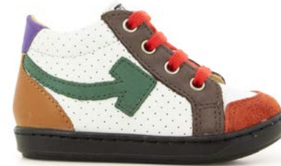
Bouba Arrow 4 - Nappa - Nubuck / White - Multi