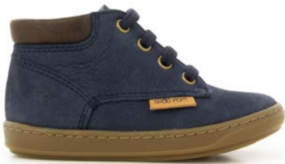
Bouba Zip Desert 1 - Longbeach / Navy - Choco