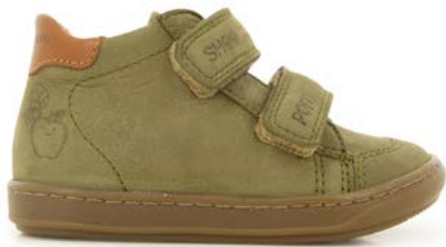
Bouba Scratchy 4 - Longbeach / Army - Camel