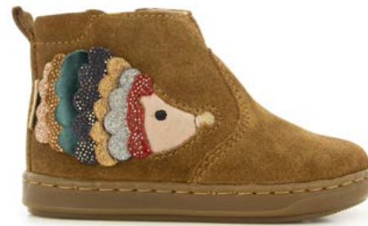
Bouba Niglo 1 - Velours / Dark Camel - Multi