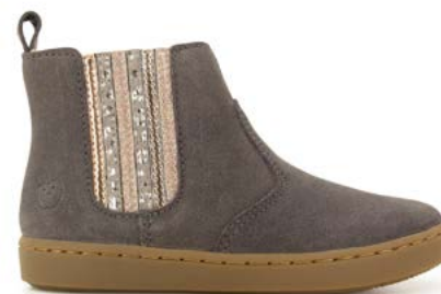
Play New Shine 3 - Velours / Anthracite - Multi