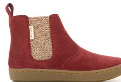
Play Chelsea 4 - Velours / Holly Berry - Copper