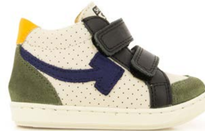
Bouba Scratch Arrow 3 - Kiri - Velours / Craie - Black - Kaki