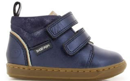
Bouba Panam 4 - Laminato - Dust / Navy - Copper