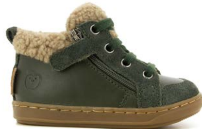
Bouba Zip Wool 2 - Kobe - Fur / Pin - Taupe