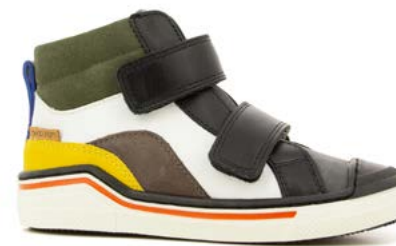
Pitch Hi Lace 3 - Nappa - Nubuck / White - Black - Multi