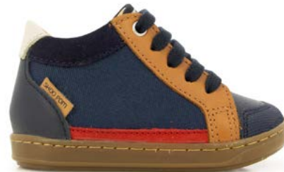
Bouba Connect 6 - Kobe - Nylon / Navy - Camel - Red