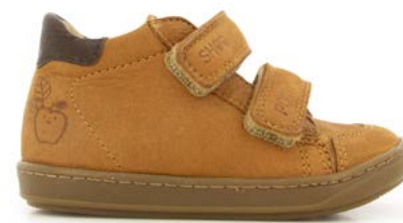
Bouba Scratchy 2 - Longbeach / Camel - Choco