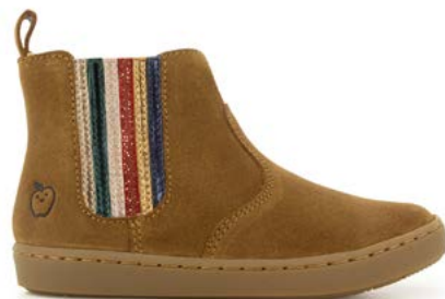
Play New Shine 2 - Velours / Dark Camel - Multi