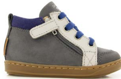
Bouba Bi Zip 3 - Nubuck - Kiri - Piombo / Grey - Blue