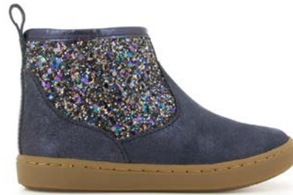
Play Co Boots 2 - Aegean - Gloss / Navy - Dark Night