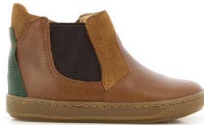
Bouba Chelsea 2 - Formosa - Velours / Camel - Pin