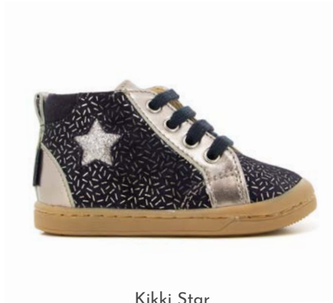
Kikki Star 1 - Candy - Laminato / Navy - Pyrite