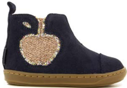
Bouba New Apple 1 - Velours - Gloss / Navy - Copper