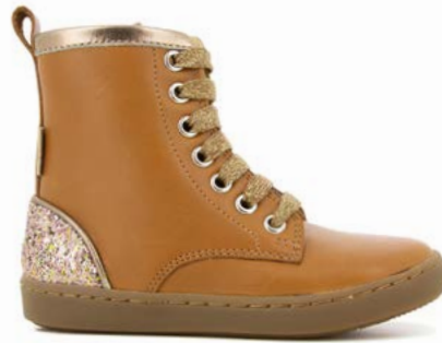
Play Hi Cut 2 - Chip Munk - Gloss / Camel - Golden