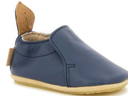
Shoo Easy 3 - Sheep / Deep Blue