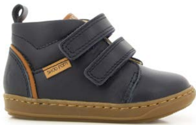
Bouba Panam 1 - Nappa / Navy - Camel