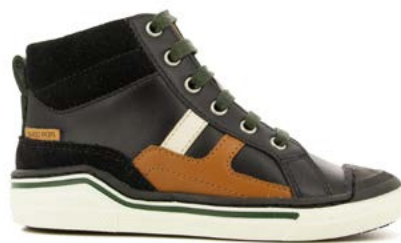
Pitch Hi Lace 2 - Nappa - Velours / Black - Camel - Craie