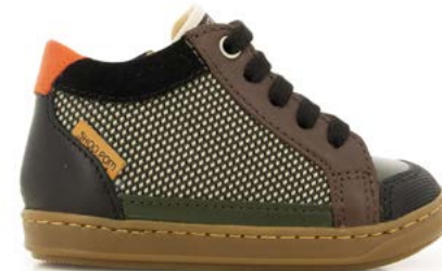
Bouba Connect 7 - Nubuck-Nylon/Square-Kaki-Choco-Rust