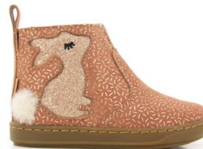
Bouba Pimpin 4 - Candy - Glitter / Old Rose - Copper