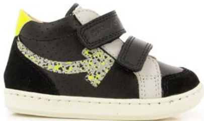
Bouba Scratch Arrow 2 - Nappa - Reflex Spoty / Black - Grey - Jaune