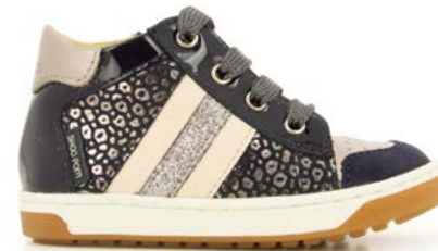
Oops Ducky 5 - Baby Leo - Vernis / Navy - Etain