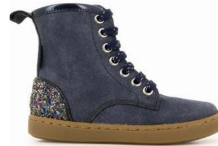
Play Hi Cut 3 - Aegean - Gloss / Navy - Dark Night