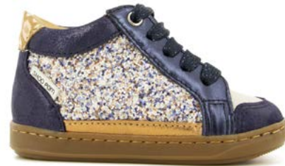
Bouba Connect 2 - Gloss - Dust / Navy - Old - Gold