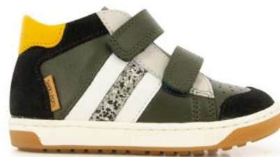
Oops Scratchy 2 - Kobe - Velours / Pin - Black - Ocre