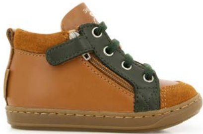
Bouba Bi Zip 2 - Kobe - Velours / Camel - Pin