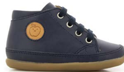
Cupy Zip Lace R1 - Regatta / Navy