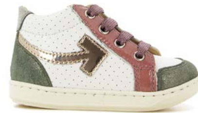
Bouba Arrow 7 - Nappa - Vernis / White - Eden - Old Rose