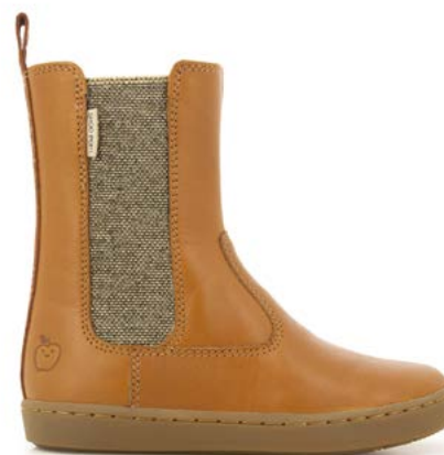
Play Hi Boots 2 - Chip Munk - Dotted / Camel - Platine