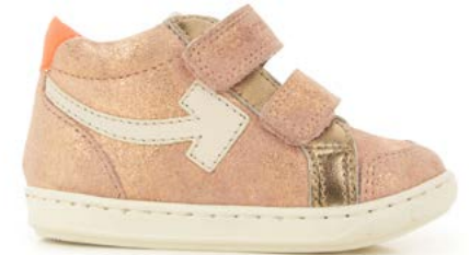
Bouba Scratch Arrow 6 - Aegean - Laminato / Old Rose - Copper - Peps