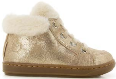
Bouba Zip Hair 1 - Dust - Fur / Taupe - Platine