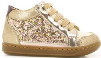
Bouba Connect 1 - Gloss - Dust / Golden - Pink - Purple