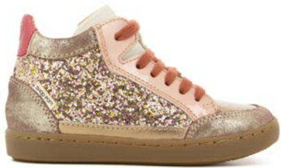
Play Connect 2 - Gloss - Vernis / Golden - Old Rose - Copper